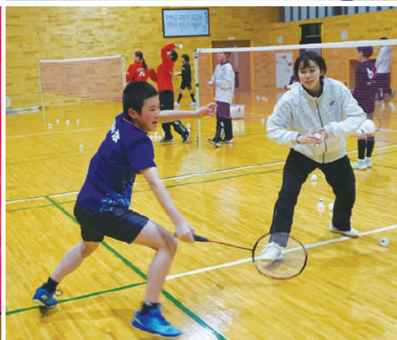
ごうぎんバドミントンチーム