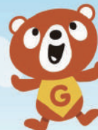
エヌケーシー ゴールドカードキャラクター 金太くん

またCSRの一環として、本社前の桜土手を景観保全のため「NKCシェードガーデン」として花壇の整備、日本パトミントNS/Jリーグ所属チーム「チアフル鳥取」のスポンサー企業でもあり、所属選手を雇用するなどの支援活動をおこなっています。