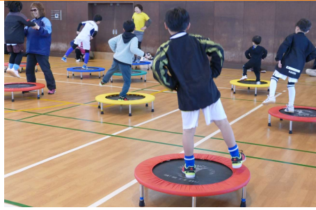
SAKAMOTO の音楽に合わせて動く