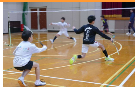
コートの端から端まで移動して フォアとバックでラケットを振る

令和6年1月13日(土)、スポーツしよい大山主催の「令和5年度県民まるごとスポーツ推進事業:みんなdeユニスポ ※1 」(県スポーツ協会補助事業)で、「バドミントンアスリート教室」を名和農業者トレーニングセンターで開催しました。