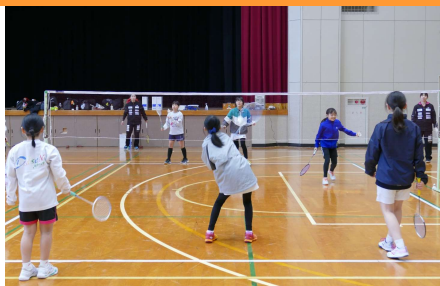
クリア・ドロップ・ヘアピンなどを練習