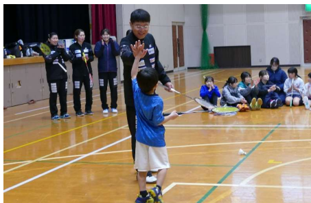
得点が入りハイタッチ!!