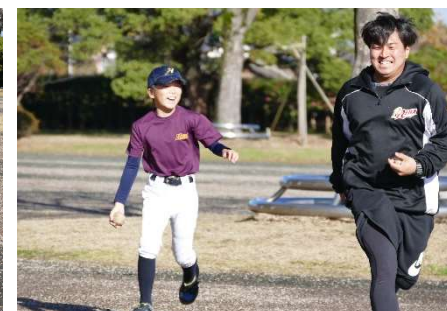
コーチもダッシュしてみた