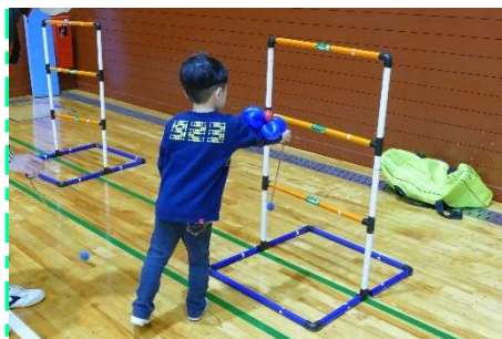
日吉津村教育委員会 ラダーゲッター