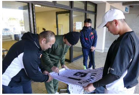
山本選手のユニホームにサインをもらう