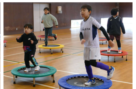
みんなノリノリで踊りました