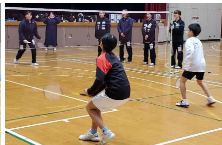
中学生コンビで果敢に攻めます。