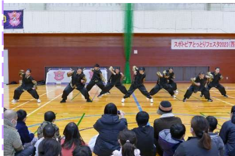
にちなんダンススクール オープニングダンス