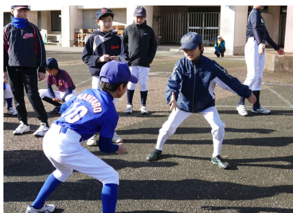
あいこでスタート