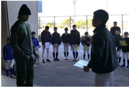
寄せ書きの色紙を手渡す