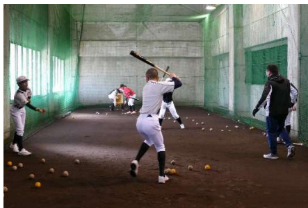
バッティング練習