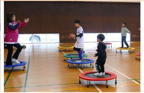
ドラえものの音楽に合わせて動く

令和6年1月27日(土)、NPO法人ウルトラスポーツクラブ主催の「令和5年度県民まるごとスポーツ推進事業：親子deスポーツ※1」(県スポーツ協会補助事業)で、「親子トランポ・ロビックス※2教室」を実施しました。