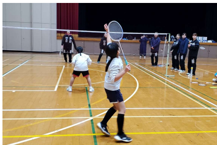
姉妹で良いコンビネーションです