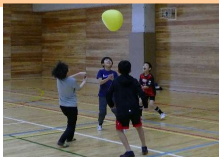
フラバールバレー