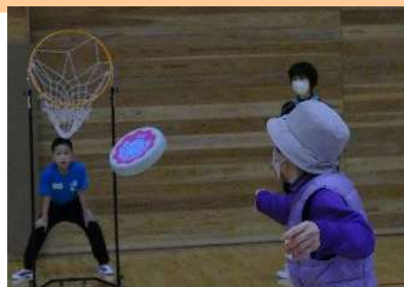
フリスビー的入れ

令和5年4月1日(土)、日南町体育館・日南町グラウンドにて、にちなんスポーツクラブ設立記念イベント「いろいろなスポーツ体験会」が開催されました。