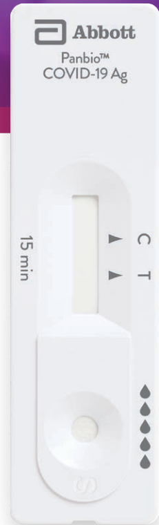
Panbio™ COVID-19 Antigen ラピッド テスト