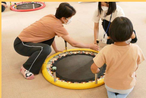
脚がしっかり装着されているか確認