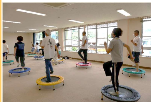
音楽に合わせて動く

令和4年7月24日(日)青谷スポーツクラブが青谷地区公民館に出向き、「県民まるごとスポーツ推進事業:みんなdeユニスポ *1 」をテーマに「あおやまるごとスポーツ体験会 *2 」を開催しました。