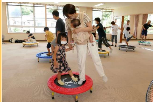
二人で乗ってみる