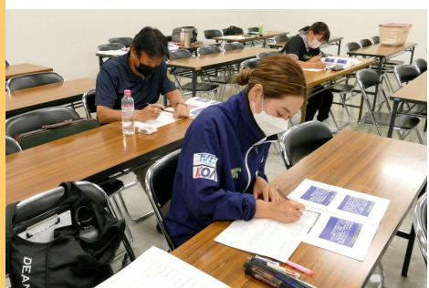
ワークシートに書き込み