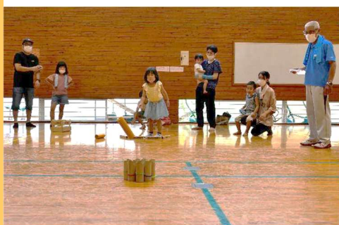
一投目 スキttlめがけて投げる