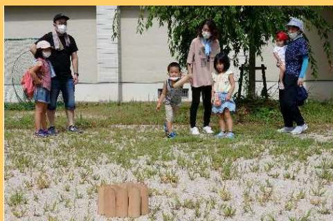
練習してみる(明倫小学校校庭)