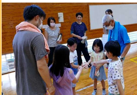
ジャンケンで投球順を決める(明倫小学校体育館)