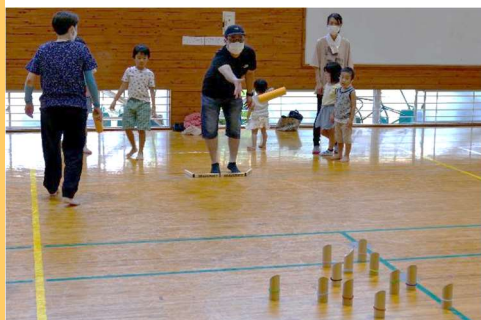
バラけたスキttlに狙いを定めて投げる

令和3年8月7日(土)、明倫小学校(倉吉市)でサンリンク・スポーツ主催の「県民まるごとスポーツ推進事業」(県委託事業)で「モルック※」を開催しました。