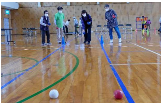
ビュットに近づけます

令和3年6月17日(木)、若桜町立第1町民体育館で町内の高齢者を対象とした「若桜氷ノ山寿大学」で今回は、ペタンク・ディスクゲッター・カローリング(ニュースポーツ)を体験していただきました。