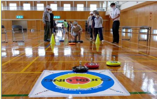
ストーンを的に近づけます