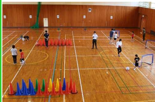
コースは6コース。親子で協力して様々な障害を乗り越えました。

令和3年6月13日(日)、南部町農業者トレーニングセンターでかぞくの日事業 ※1 (町委託事業)で「サッカーでゴルフ」を開催しました。