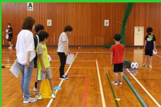
フラフープの中になかなか納まりません