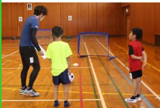
ミニゴールの障害物も、ここにシュートを入れてから先に進みます。