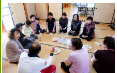
お茶とお菓子でおしゃべり

平成30年3月13日(火)、金屋谷地区公民館で健康運動教室「まめまめクラブ」に、地域の高齢者210名が参加しました。