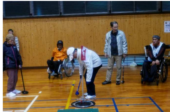
見られてると緊張するなあ

平成30年3月20日(火)、倉吉市営体育センターで「ミズノ杯！フロアグラウンド・ゴルフ交流大会」が開催されました。鳥取ろうあグラウンド・ゴルフクラブから10名と会員・地域住民の方合わせて45名(当日欠席2名)が参加しました。