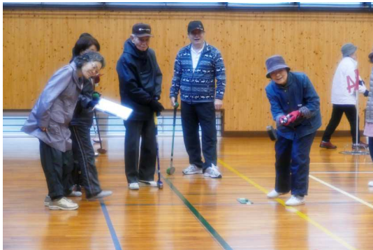
皆でボールの行方を見守る