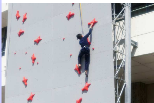
スピード壁に挑戦